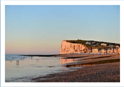
Plages et Falaises

A 90 mètres au-dessus de la mer, une vue unique au sommet de la falaise s'offre à vous.