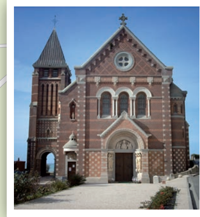
Eglise Saint-Martin

Classé site patrimonial remarquable, une agréable promenade à la découverte des villas Belle-époque où se succèdent bow-windows, balcons ouvragés, façades colorées et céramiques.