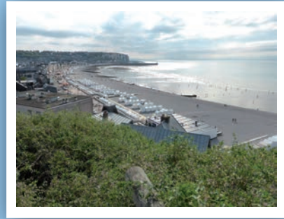
Panorama (statue Notre Dame de la Falaise)

A 90 mètres au-dessus de la mer, une vue unique au sommet de la falaise s'offre à vous.