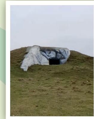
Fresque sur la falaise

De style romano-byzantin, découvrez cette église édifiée en 1928.