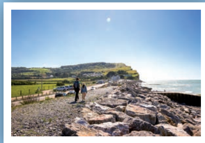
Plages et Falaises