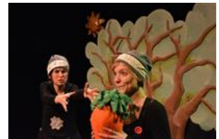
Cie l'Echappée Belle

Dès 3 mois - Réservation indispensable - Gratuit.